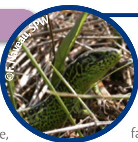
Lézard des souches

Cette diversité végétale est à son tour bénéfique à la diversité animale, notamment les insectes butineurs. De plus, le maintien d'herbes hautes, coupées le plus tard possible, est important pour les